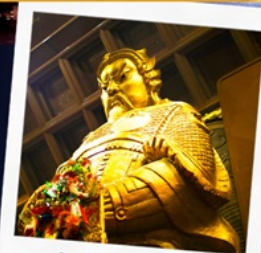
วัดเชกกงหมิว