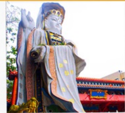
เจ้าแม่กวนอิม