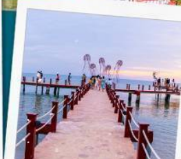
Sunset Sanato Beach Club