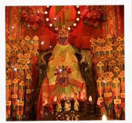
เจ้าแม่กวนอิมวัดสองอ่า