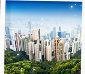
จุดชมวิวกาอิกตอเรีย