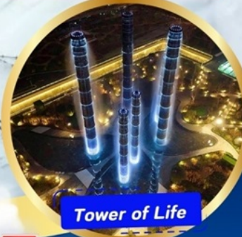
Tower of Life

อุทยานภูเขาสี่ฤดู หุบเขาของเฉียวโกว (รวมรถอุทยาน) อุทยานปีเพิงโกว(รวมรถอุทยาน + รถแบตเตอรี่ ) ภูเขาหิมะการ์เซียต้ากู่ปิงชว่น (รวมรถอุทยาน+กระเช้า) - วัดต้าฉือ ถิ่นคนเดินชุนซีลู่ - ชมแสงสี The Tower of Lifeที่ลานห้าง SKP ถนนคนเดินชอยกวางแคม - POP MART