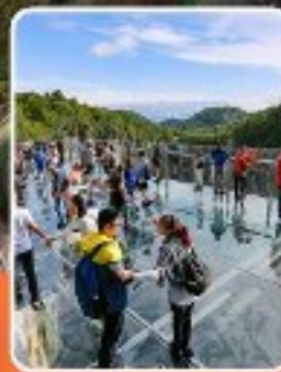
ระเบียบแก่ว๋หลง

ภูเขาหว่าอูซาน (รวมขึ้นกระเช้าไป-กลับ)- อุทยานเขานางฟ้า อุทยานหลุมฟ้าสะพานสวรรค์ - ระเบียบแก่ว๋หลง - รถไฟฟ้าทะเลตึก หงหยาดัง - วัดเป้ากั๋ว - หลวงพ่อโตเสอซาน - วัดต้าอิว หมี่เพนค้ายักษ์ ซ็องปิ่ง ถนนคนเดินซุนซ็ู โท่กู๋หลี่