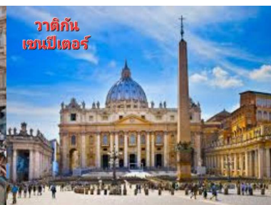
วาติกัน เซนต์ปีเตอร์