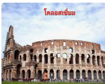
โคลอสเซียม