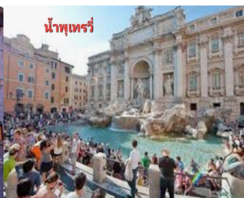
น้ำพุเทร่