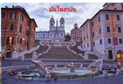
บันไดสเปน