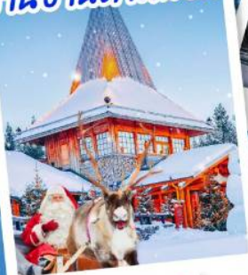
หมู่บ้านซานตาคลอส