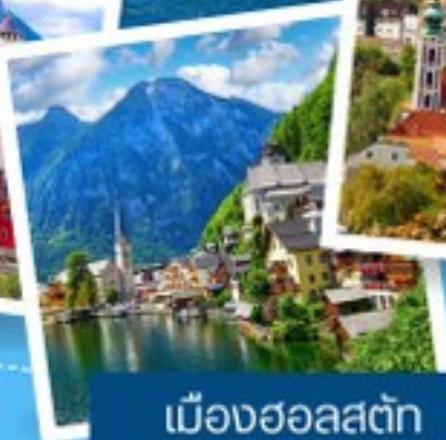
เมืองซอลสตัด