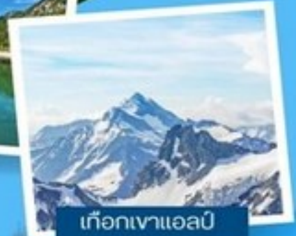
เทือกเขาแอลป์