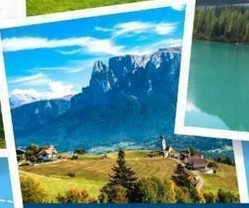
เมืองโบลซาโน