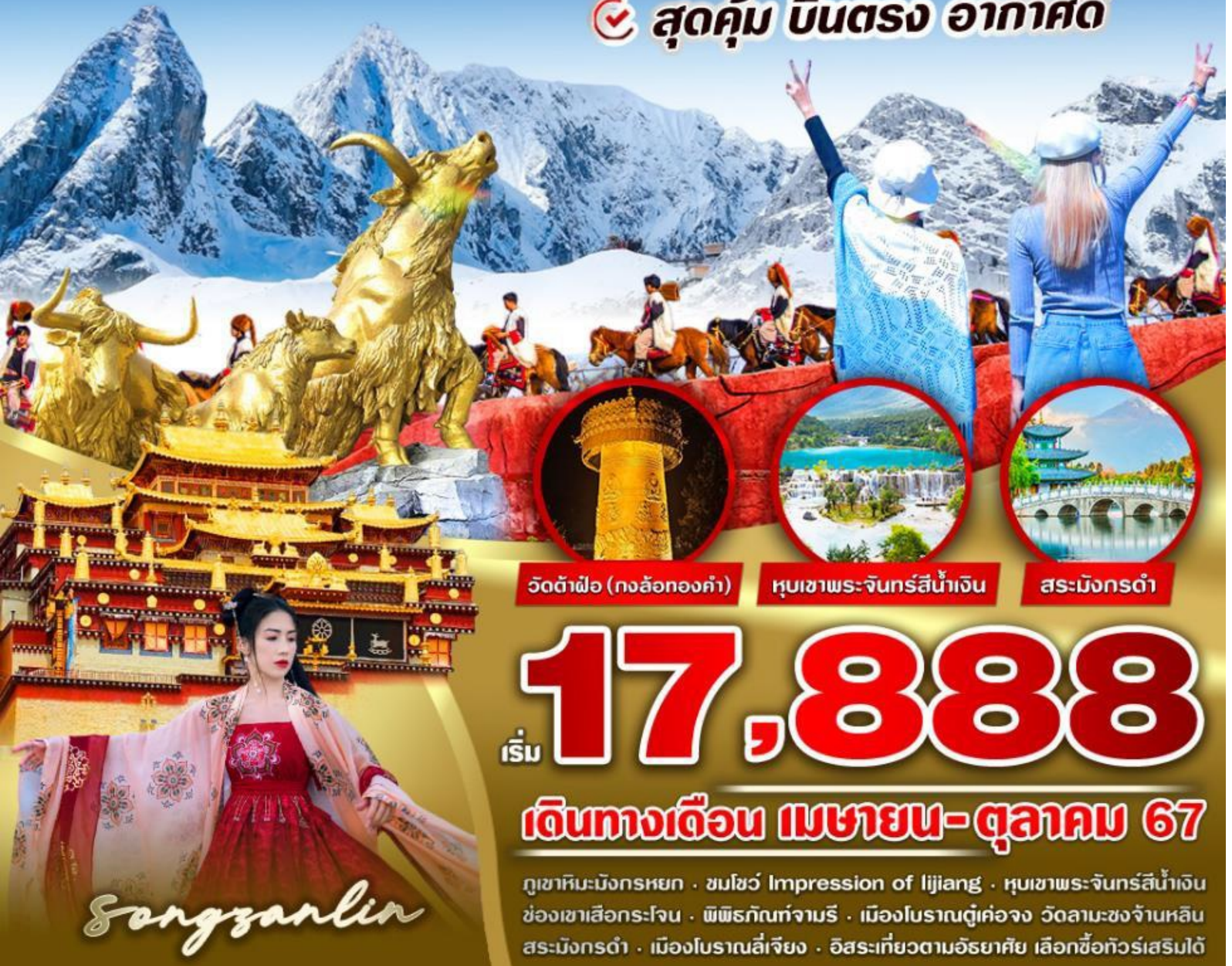
วัดต้าฝื่อ (ทงล้อทองคำ)