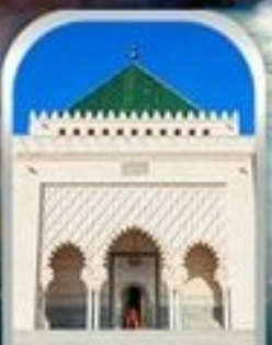
MOHAMMED V SQUARE