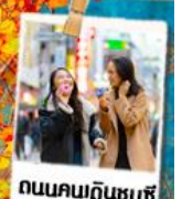
ถนนคนเดินชุนซี