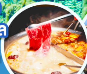
ชาบูหม่าล่า