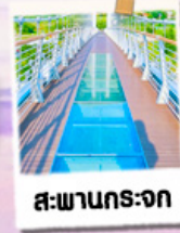
สวนกระถก