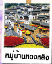
หมู่บ้านทองหลาง