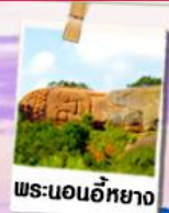
พระนอนอียาง