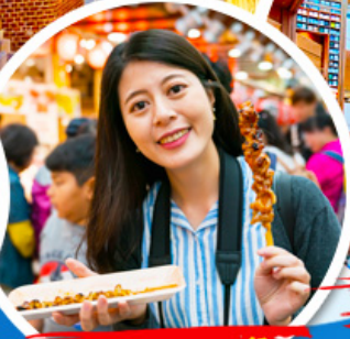
ตลาดควางจ้ง