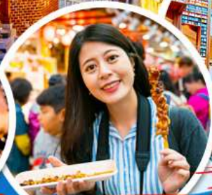
- ตลาดควางจั้ง