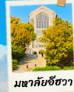
มหาชัยชีวา