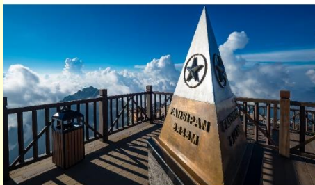
ยอดเขาฟานซิปัน