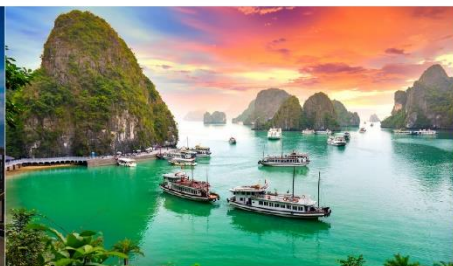
ล่องเรือชมอ่าวฮาลอง