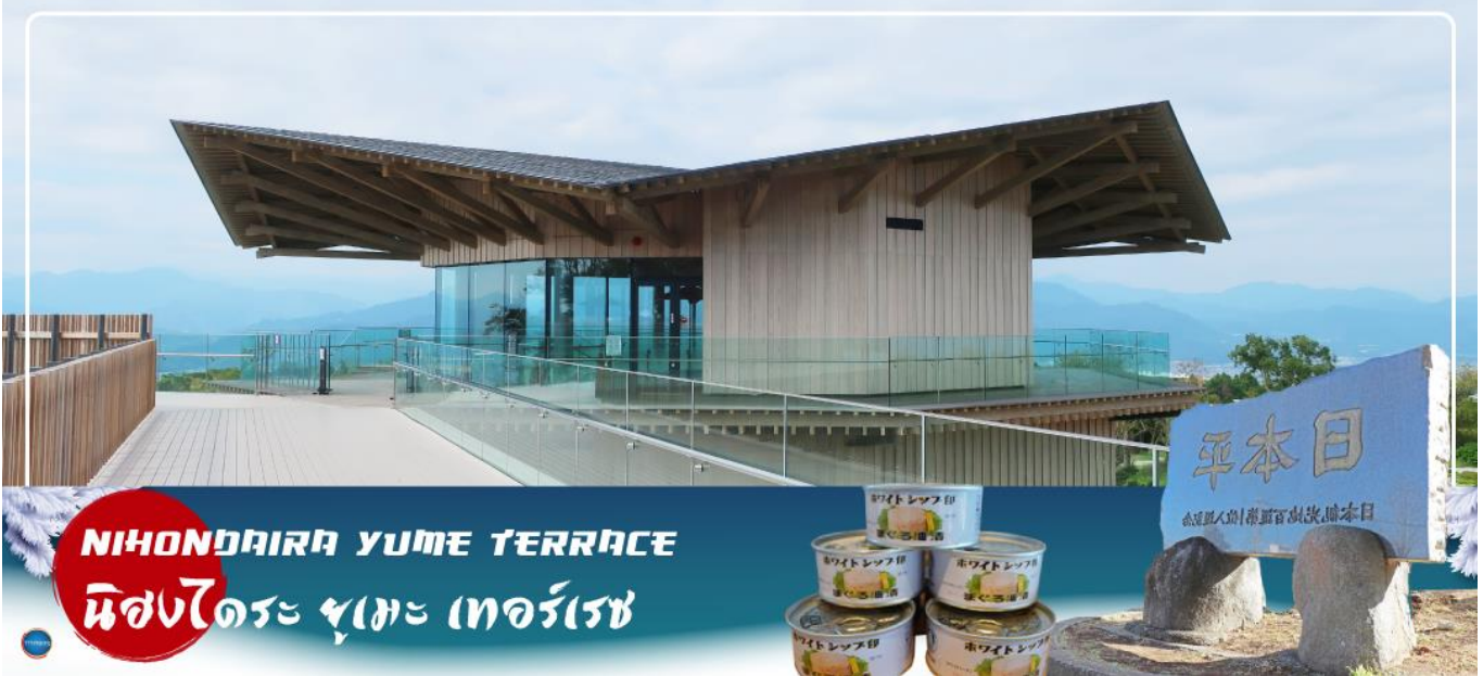
NIHONDAIRA YUME TERRACE นิสงไดระ ยูเมะ เทอร์เรซ