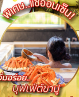
อิมมอร์ทัล บุฟเฟ่ต์ชาบู