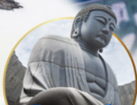
ชมเนินพระพุทธรเจ้า.. Hill of the Buddha

📍 ไฮไลท์!! สนุกสนานกับกิจกรรมทะเลหิมะ ณ ลานสโนว์ เวิลด์ ชิชิโนะยาม่า เยี่ยมชมเนินพระพุทธรเจ้า ชมความน่ารักเหล่าสัตว์ ณ สวนสัตว์อาซาฮิยาม่า ชมคลองโอดารุ เข้าชมพิพิธภัณฑ์ถ้ำถ้ำลอดดนตรี ล้อมรสราเมง ณ หมู่บ้านราเมนอาซาฮิคาว่า ช้อปปังจู้ใจ กาบุกุโคโนอิ อิมมอร์รอย!! บุปเฟ่ต์ซาบู และซาบูยักนิ