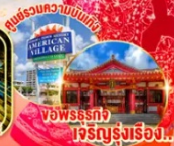
ชมพร้อมความบันเทิง ว้อพรธกั เจริญรุ่งเรือง!