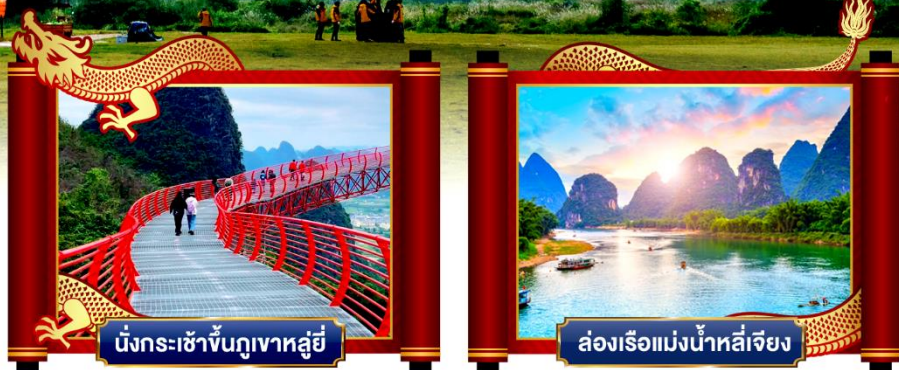
นั่งกระเช้าขึ้นภูเขาหลู่ยี่