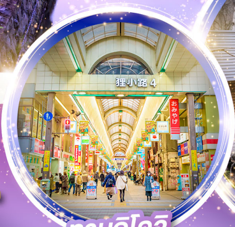
ทานุกิโจจิ