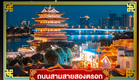
ถนนสามสายสองตรอก