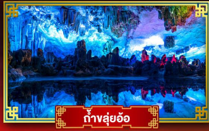
ถ้ำสุ่ยอ้อ

"ดินแดนแห่งสายน้ำและขุนเขา" สัมผัสประสบการณ์นั่งบอลลูนชมวิวมุมสูง