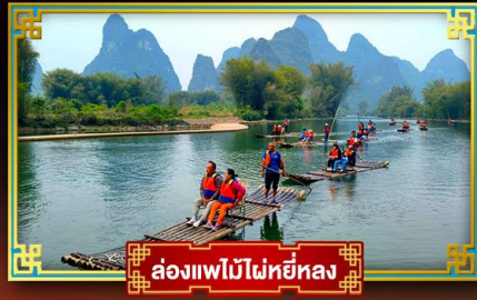
ล่องแพไม้ไผ่หยี่หลง