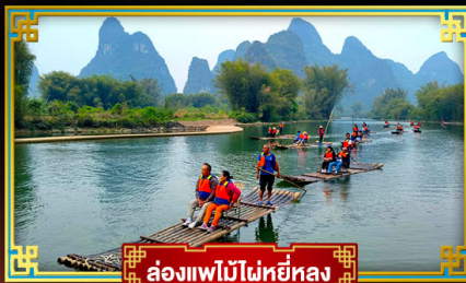
ล่องแพไม้ไผ่หยี่หลง