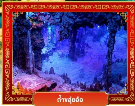
ถ้ำสุ่ยอ้อ