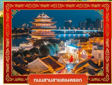
ถนนสามสายสองตอ