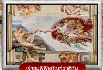
เข้าชมพิพิธภัณฑ์วาติกัน

เมนูพิเศษ! สปาเกตตีเส้นหมึกดำ, พิชซ่าสไตล์อิตาลีเย็นแท้