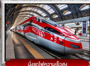
นั่งรถไฟความเร็วสูง