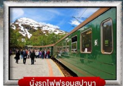
นั่งรถไฟพร้อมสปา

พิเศษ! พักบนเรือสำราญ แบบ Window Room 2 คืน, พักบ้านแซนต้าคลอส