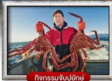
กิจกรรมจับปูยักษ์