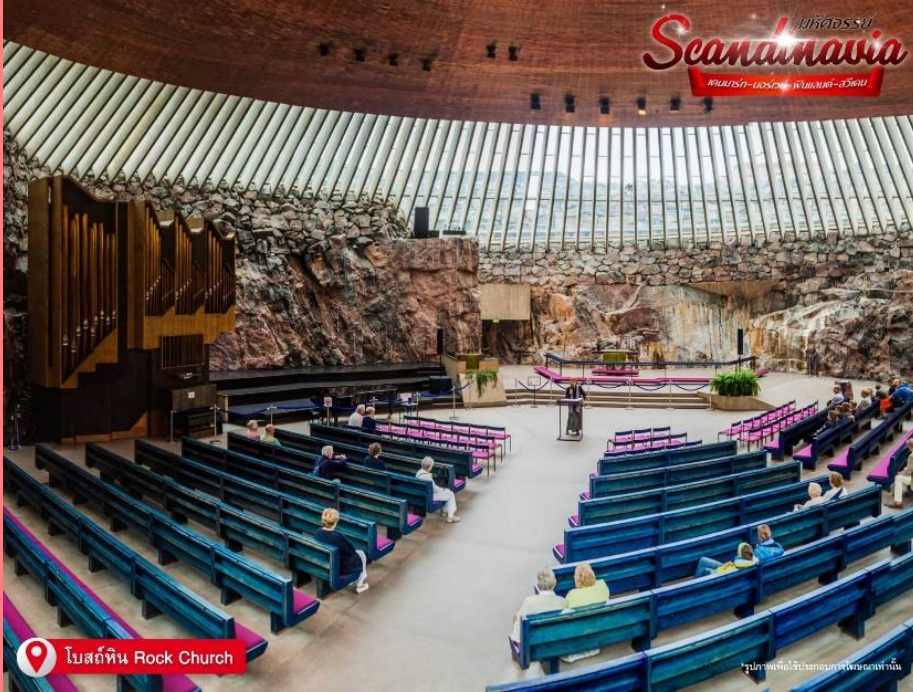
โบสถ์หิน Rock Church

โบสถ์เทมเปลิโอคิโอ หรือ โบสถ์หิน (Rock Church) เป็น โบสถ์ ที่มีสถาปัตยกรรมแปลกกว่าที่อื่น โดยแต่เดิมพื้นที่ของโบสถ์นี้เป็นเนินเขา และผู้ออกแบบได้ใช้วิธีสร้างโบสถ์ที่น่าสนใจ คือระเบิดเนินหินตรงกลางเพื่อสร้าง โบสถ์ในนั้น โบสถ์ที่ได้ขึ้นชื่อว่าเป็น โบสถ์แห่งความรัก และมีความเชื่อว่าเมื่อใครก็ตามจุดเทียน อธิษฐานเรื่องเกี่ยวกับความรักในโบสถ์นี้แล้วจะสมหวังในสิ่งที่อธิษฐาน คนฟินแลนด์มีความเชื่อเรื่องนี้ เนื่องจากโบสถ์นี้สร้างขึ้นเมื่อวันที่ 14 กุมภาพันธ์ 2511 และเสร็จเมื่อวันที่ 14 กุมภาพันธ์ของปีถัดไป เดินทางสู่ จตุรัสเซเนท (Senate