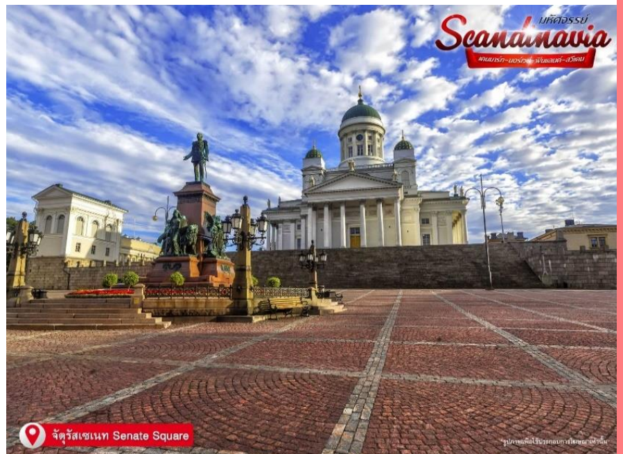
จตุรัสเซเนท Senate Square

ออกแบบสไตล์นีโอคลาสสิกสมัยศตวรรษที่ 19 ด้านหน้าโบสถ์มีรูปปั้นพระเจ้าอเล็กซานเดอร์ที่ 2 ที่บริเวณนั้น หอสมุดแห่งชาติเฮลซิงกิ (Helsinki Central library) หน้าอาคารภายนอกสีเหลือง เสาสีขาวและโถงกลมตรงกลาง ในมุมตะวันออกเฉียงใต้ของจตุรัสคือบ้านของเซเดร์โฮล์ม ซึ่งเป็นอาคารหินที่เก่าแก่ที่สุดของเมือง