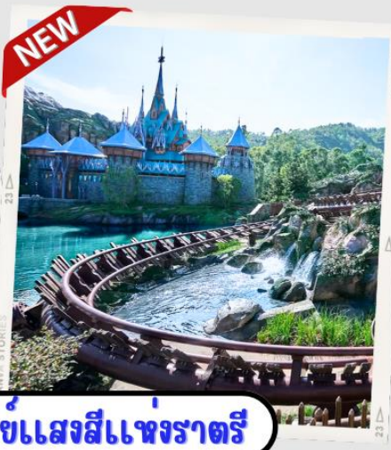
“MOMENTOUS” มหิศวรรษแสงสีแห่งราตรี