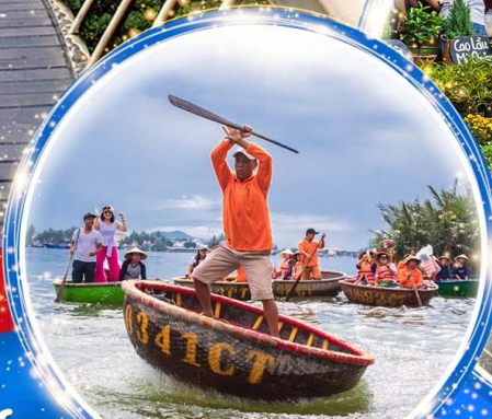
นั่งเรือกระดัง Hoi an