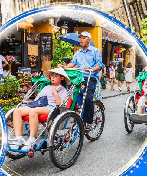
นั่งรถสามล้อไซโคล

พักบน บานาฮิลล์ 1 คืน นั่งกระเช้าที่ยาวที่สุดในโลก ขึ้นสู่บานาฮิลล์ ชมเมือง ฮอยอัน เมืองมรดกโลกที่สวยงามและเจียบสงบ พิเศษ!! บุฟเฟ่ต์นานาชาติ บานาฮิลล์