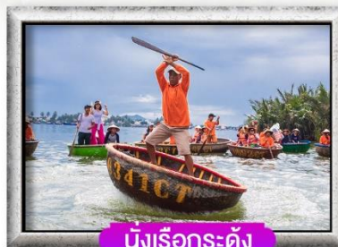
นั่งเรือกระดัง