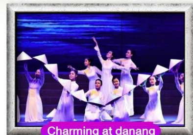
Charming at danang