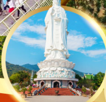
วัดหลิงอึ้ง