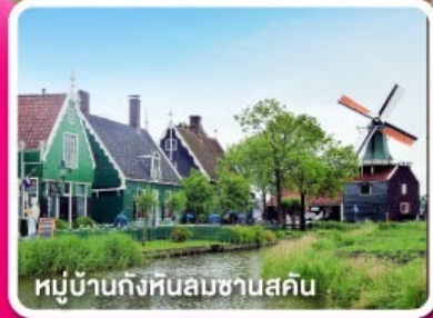
หมู่บ้านกังหันลมชาวดัตช์