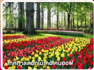
เทศกาลดอกไม้เคอเคนฮอฟ