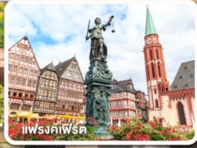
แฟรงค์เฟิร์ต

ฝรั่งเศส เบลเยียม ลักเซมเบิร์ก เยอรมนี เนเธอร์แลนด์ 8วัน 5คืน