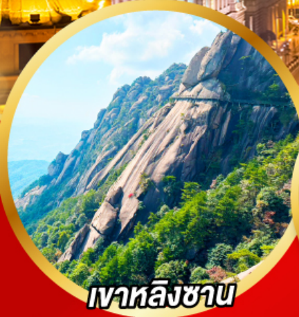
เวาหลิงซาน