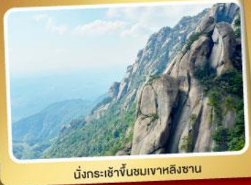
มังกร-เข้าชั้นชมเขาหลงซา