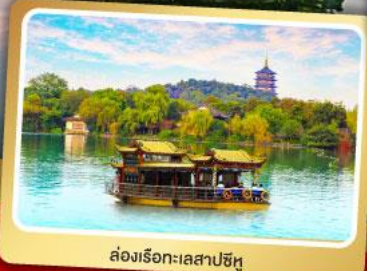
ล่องเรือทะเลสาปซีหู