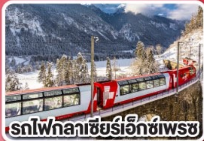
รถไฟกลาซีร์เอ็ทซ์เพรช