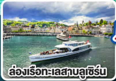
ล่องเรือทะเลสาบลูเซิร์น

เที่ยวครบเส้นทาง Jewels of Romantic Europe ของบาวาเรียและทีโรล