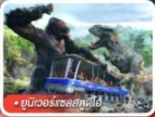
• ยูนิเวอร์สไอส์แลนด์