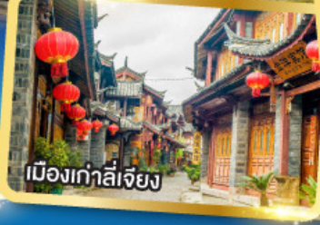
เมืองเกาลี่เจียง