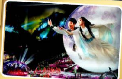
โชว์จิ้งจอกขาว