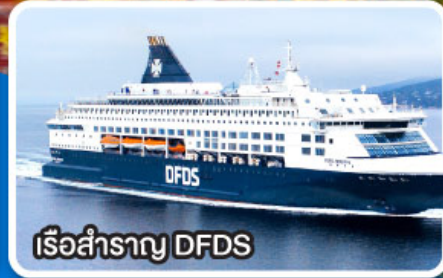
เรือสำราญ DFDS

พิเศษ ! พักค้างคืนบนเรือสำราญ DFDS SCANDINAVIAN SEAWAYS (ห้องพักแบบ SEA VIEW)