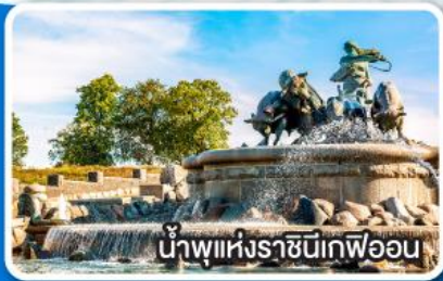
น้ำพุแห่งราชินีวิกตอเรีย