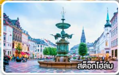
สต็อกโฮล์ม