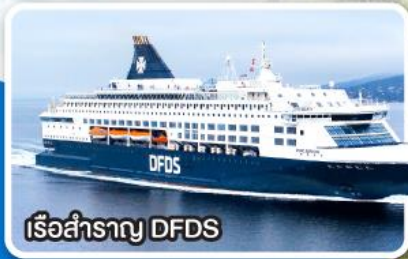
เรือสำราญ DFDS