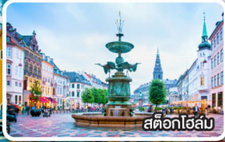
สต็อกโฮล์ม