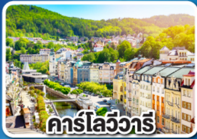
คาร์ลส์เทิร์น