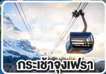
กระเช้าจุงเฟรา

เข้าแวร์ซายน์ เทียวลูเซิร์น เดินเพลินๆ เดินไปสอยไป ฝรั่งเศสและสวิตเซอร์แลนด์ 8 วัน 5 คืน