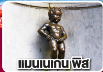
แมนเนเกน พิส

ฝรั่งเศส เบลเยียม ลักเซมเบิร์ก เยอรมนี เนเธอร์แลนด์ 8 วัน 5 คืน