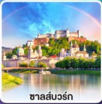
ซาลส์บวร์ก

ขึ้นรถไฟสายโรแมนติก เบอร์นีนา เอ็กซ์เพรส ชมวิวตระการตาของสวิส