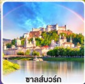
ซาลส์บวร์ก