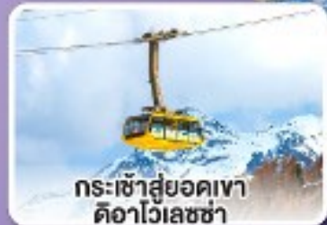
กระเช้าสู่ยอดเขาดืออาไวเลซซา