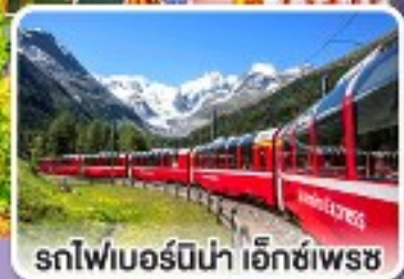
รถไฟเบอร์นีนา เอ็กซ์เพรส

รถไฟสายโรแมนติกและยอดเขาสุดพีคสุด อิตาลี สวิตเซอร์แลนด์ ออสเตรีย สโลวาเกีย 10 วัน 7 คืน