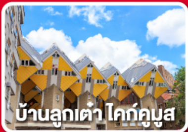
บ้านลูกเต๋า โคทักกูบัส