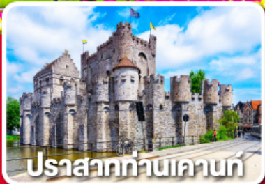
ปราสาทท่านเคานท์