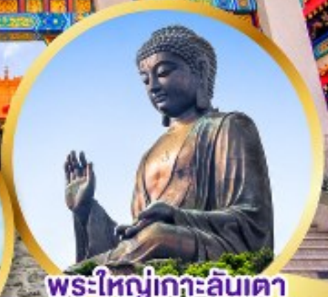
พระใหญ่เกาะลันเตา