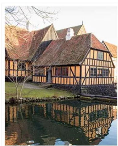
Aarhus , Norway