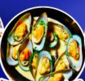
หอยแมลงภู่นิวอิงแลนด์