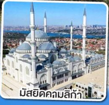
มัสยิดคคมลิก้า