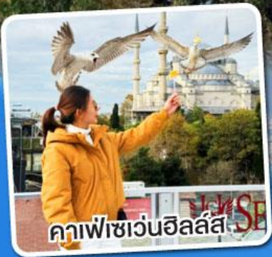
คาเฟ่เซเวนฮิลล์ส์

ฟรี!! แวงกุญแจ Evil Eye ชาแอปเปิ้ล, ไอศกรีมมาโก