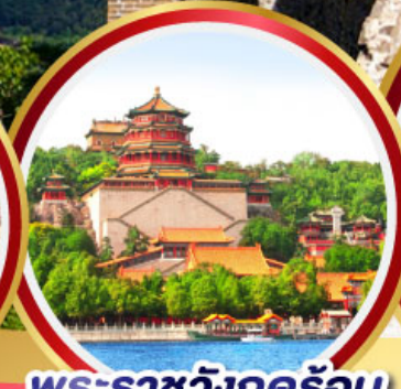
พระราชวังฤดูร้อน อิ๋นโฮหยวน