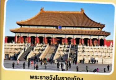
พระราชวังโบราณปักกิ่ง