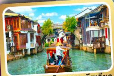
ล่องเรือเมืองโบราณซูโจวเจียว