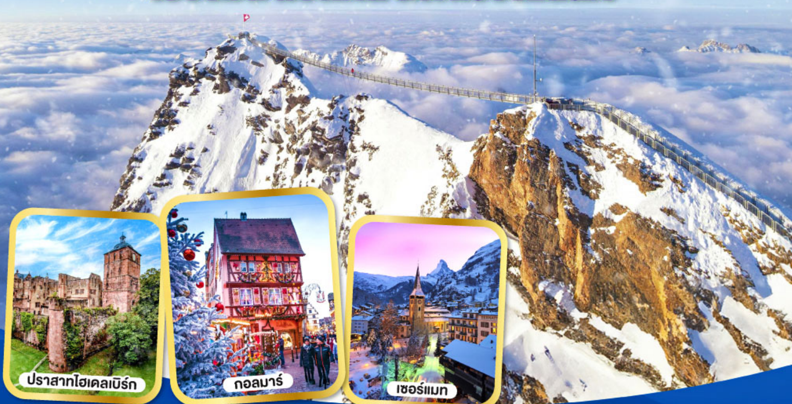
ปราสาทไฮเคลเบิร์ก